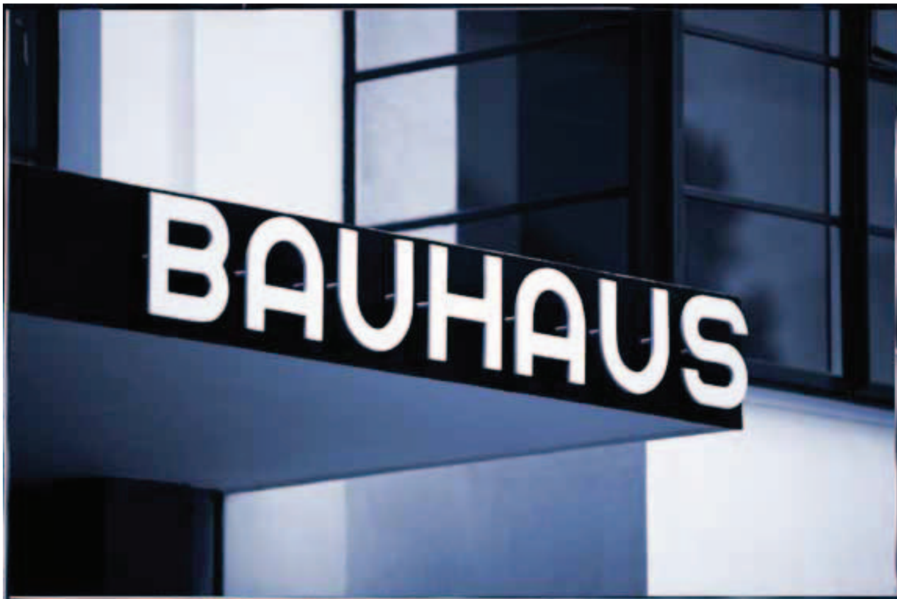
budova Bauhaus, Dessau, Germany (1925-26)

Walter Gropius a dve ďalšie vedúce osobnosti Bauhausu - architekti Hannes Meyer a Ludwig Mies van der Rohe predstavili princípy, ktoré formovali vznik modernej architektúry. Ich filozofia spočívala vo vytváraní klasických tvarov bez vonkajších ozdôb pričom zahŕňala technológie a zdôrazňovala hľadanie riešení na vtedajšie problémy dizajnu v urbanistickom plánovaní, bývaní a úžitkovej masovej produkcii.