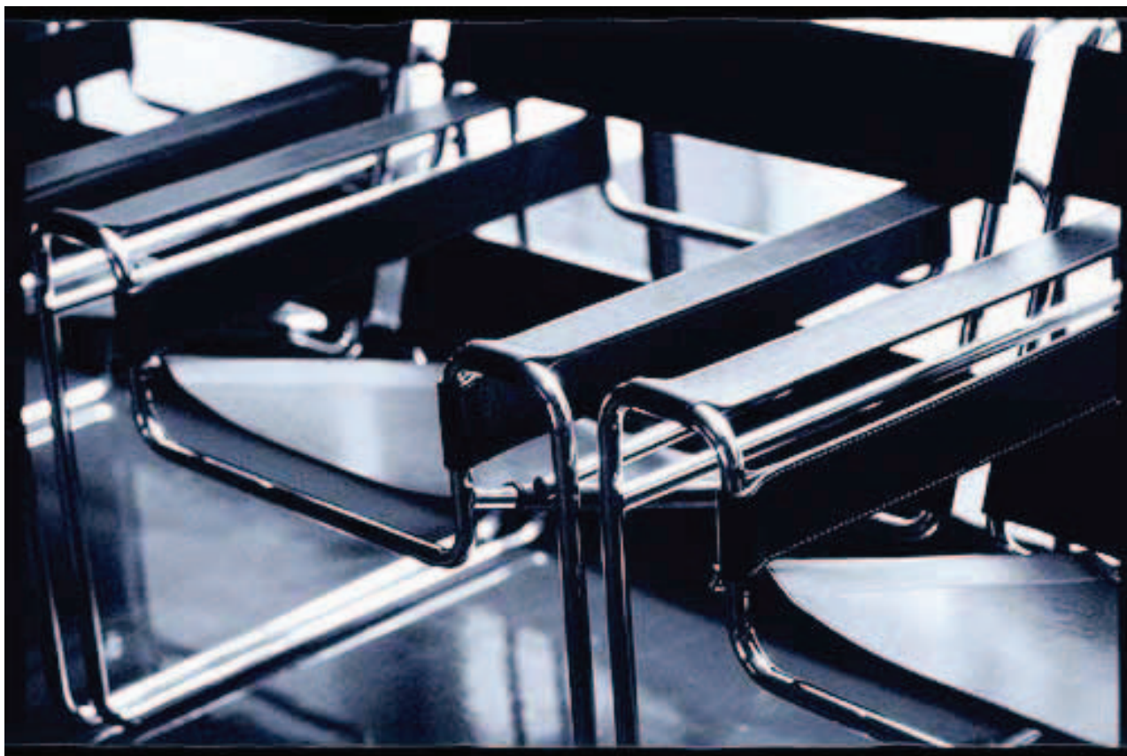
Wassily chairs, Marcel Breuer (1925)

„Originálny pohľad na hnutie Waltera Gropiusa založeného vo Weimare v roku 1919.“ LE POINT (FRANCE)